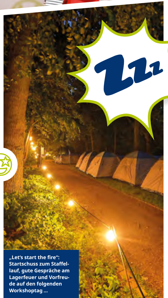
„Let's start the fire“: Startschuss zum Staffellauf, gute Gespräche am Lagerfeuer und Vorfreude auf den folgenden Workshoptag ...

TONI KÖPPEN, BÜRGERMEISTER STADT BAD SEGEBERG