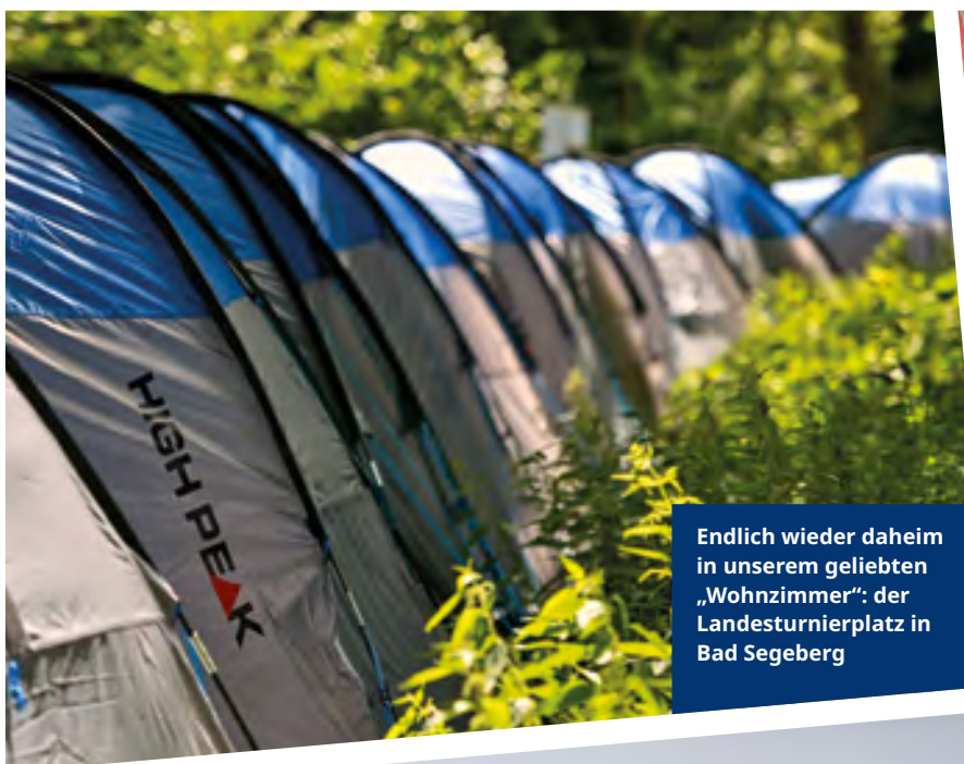
Endlich wieder daheim in unserem geliebten „Wohnzimmer“: der Landesturnierplatz in Bad Segeberg