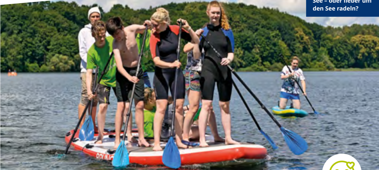
Paddeln auf dem Großen Segeberger See – oder lieber um den See radeln?