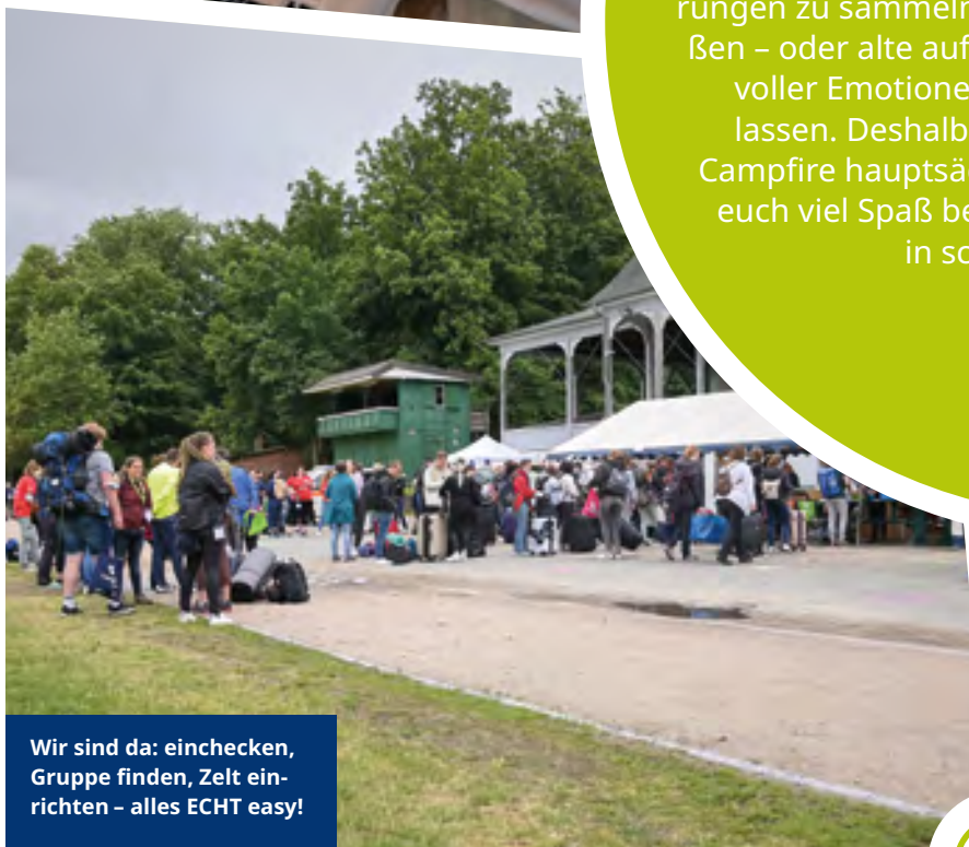
Wir sind da: einchecken, Gruppe finden, Zelt einrichten – alles ECHT easy!