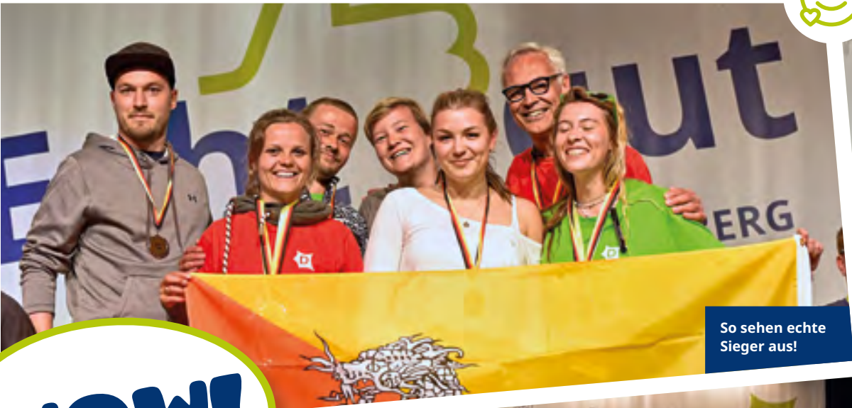
So sehen echte Sieger aus!