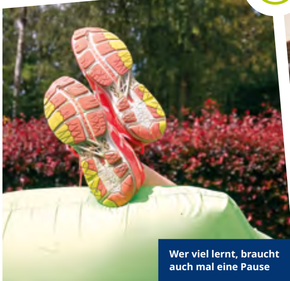
Wer viel lernt, braucht auch mal eine Pause